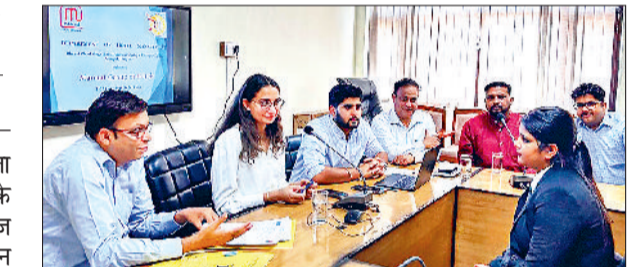
गोहाणा। महिला विवि के होटल प्रबंधन विभाग में आयोजित कैपस प्लेसमेंट ड्राइव में भाग लेते हुए छात्रा।