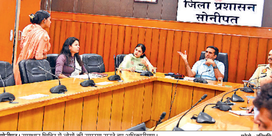
सोनीपत। समाधान शिविर में लोगों की समस्या सुनते हुए अधिकारीगण।