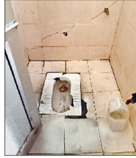
सोनीपत। शौचालय की टूटी पड़ी सीट व सीवर ब्लॉक के चलते भरा दूषित पानी।