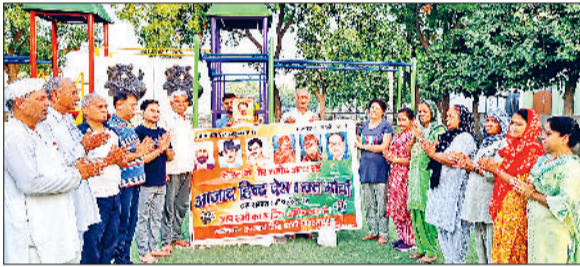
गोहाणा। रामप्रसाद बिस्मिल को नमन करते हुए नागरिक।